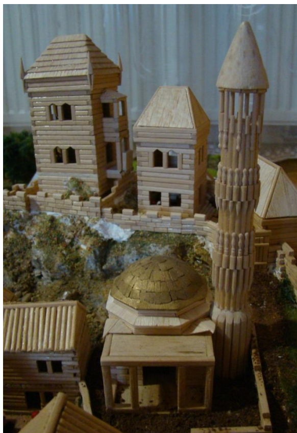
Mešita, za ní hrad Karlštejn