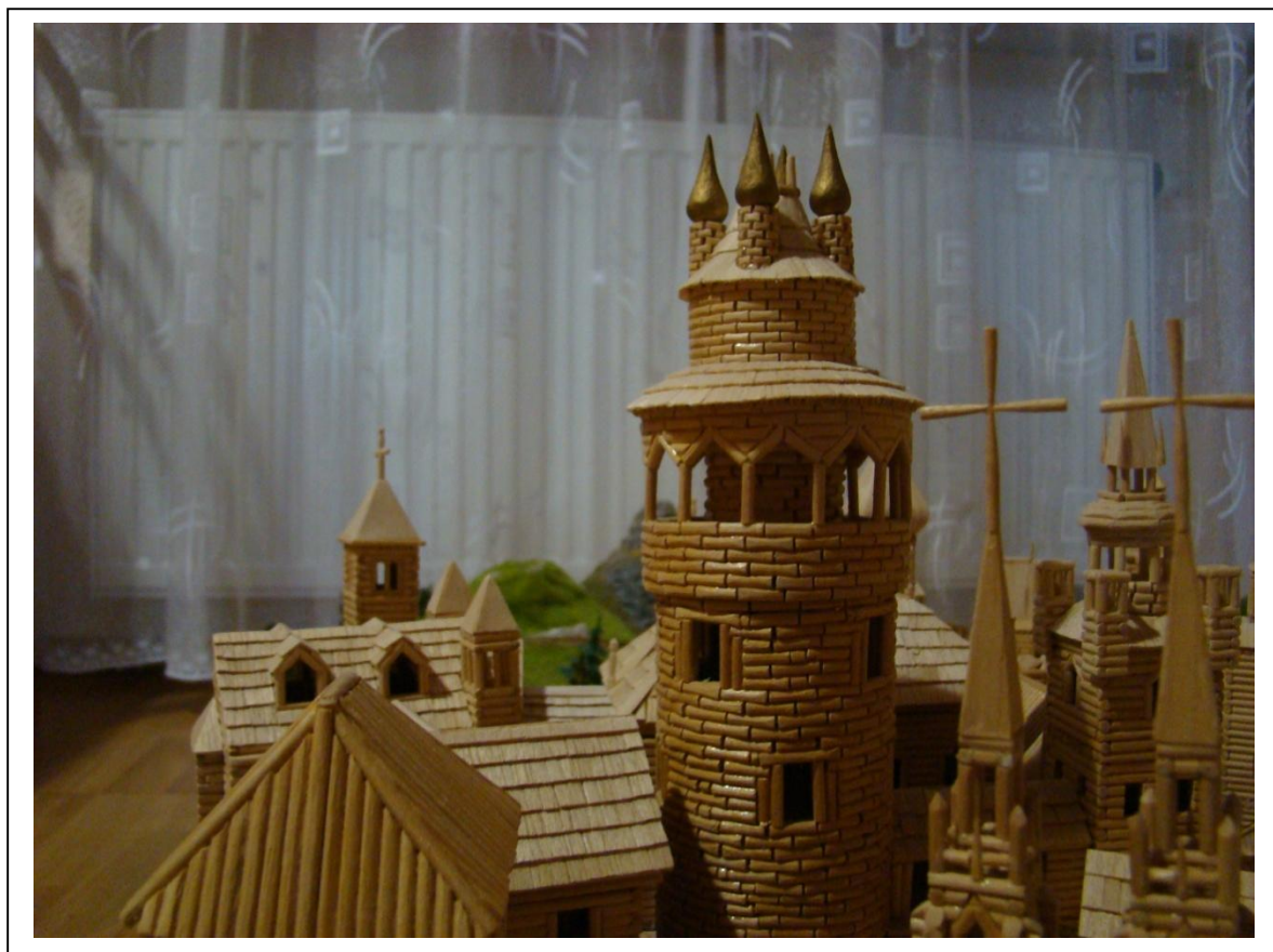
Foto měsíce: Patriciji a její dominantu – Gilsbornovu věž – postihla silná bouře.