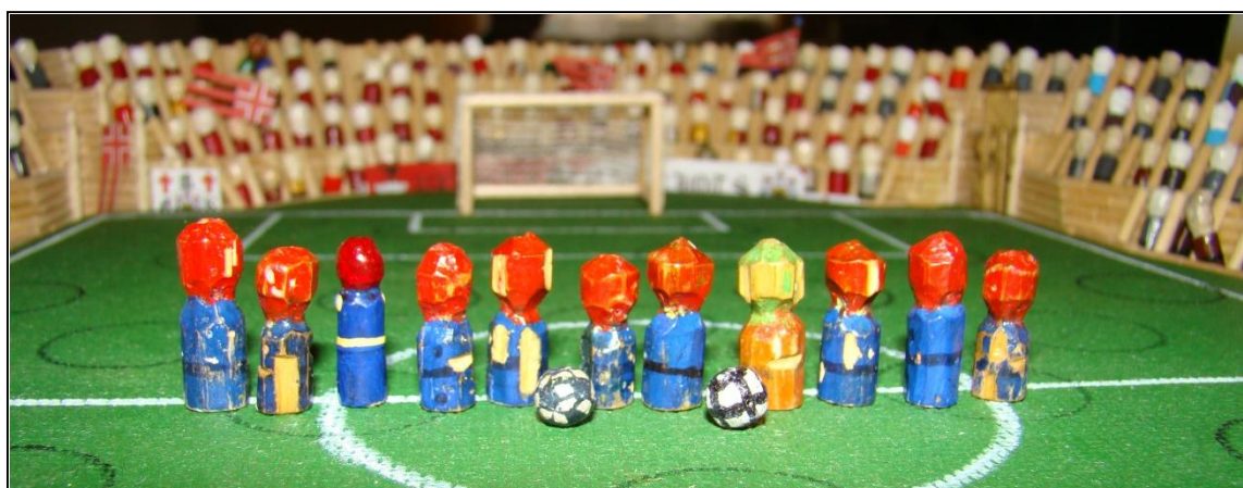
Druhé místo je skogomadrským úspěchem

K letošnímu Poháru je nutné poznamenat, že skogomadrský fotbal stoupá vzhůru a umístění Mon Ferera neodpovídá nasazení jejich fotbalistů a jejich bojovnosti a touze po vítězství.