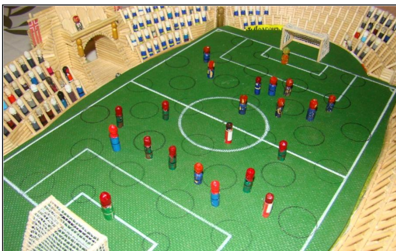
Utkání Mon Ferera se Skogomadrou

Letošní Pohár Jižních zemí hostil Olympijský stadion v Patriciji a opět se ukázalo, že pořádající země je před svými diváky svázána určitou nervozitou. „Jediné vítězství je velice málo. Tento nezdar přikládáme tomu, že se po dva roky nehraje naše kontinentální fotbalová liga,“ prozradil Pergamenu kapitán