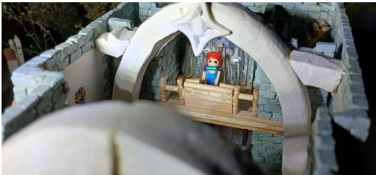
Laima v katedrále

v gondolské nemocnici a následně potom absolvovala jemnou plastickou operaci v Havrányi. Tamější plastičtí chirurgové se snaží přiblížit světové špičce, která se stále nachází v Rošfórské říši, kde jsou zřejmě nejkrásnější ženy na světě. No – jak to dopadlo? Celkem skvěle. Laima se