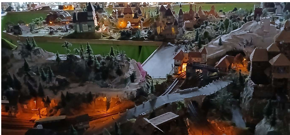
iiiland se již pyšní více než stovkou světél

roku dovézt do Galaxie ZR k opravě. Prostě do něj nejde proud a máme strašně málo chytrých inženýrů.