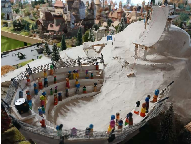
Dvě disciplíny bude hostit i Království Kateřinské

Je rozhodnuto! Dne 27. – 28.12. 2024 se v iilandu bude konat již tradiční Větrnický zimní pohár. Tato soutěž je otevřená pro všechny státy (i národy, tj. třeba i pro Blesky nad Kalamitou nebo třeba i pro „mrtvou“ Dakkarii). Sponzorem akce bude Větrnický pivovar Ol (vlastně božská Holba), který napojí účastníky pivem ještě než vyjedou ke startu a ze startu. Soutěžít se bude v klasických disciplínách, tj. skok, sjezd, slalom, obří slalom, běh na lyžích, boby.