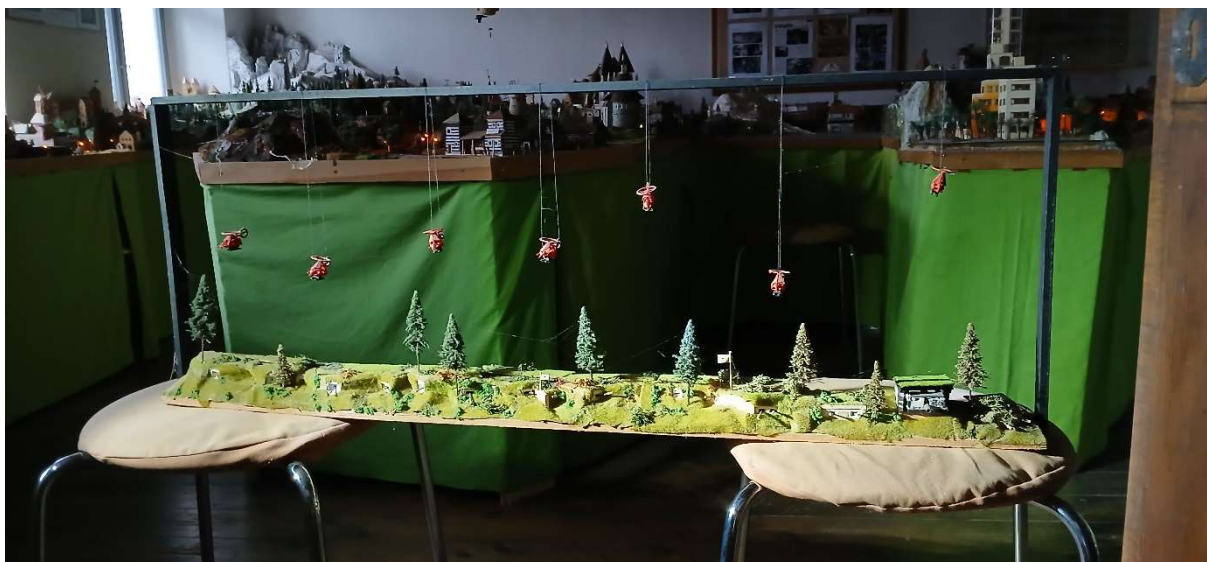
Mannerheimova linie je znovu opravená

Větrnická unie tímto odpovídá na langarské válečné štvání a je připravena v případě ozbrojeného konfliktu ji po vyhrané válce připojit i s jejími satelity k iilandu jako větrnickou kolonii.