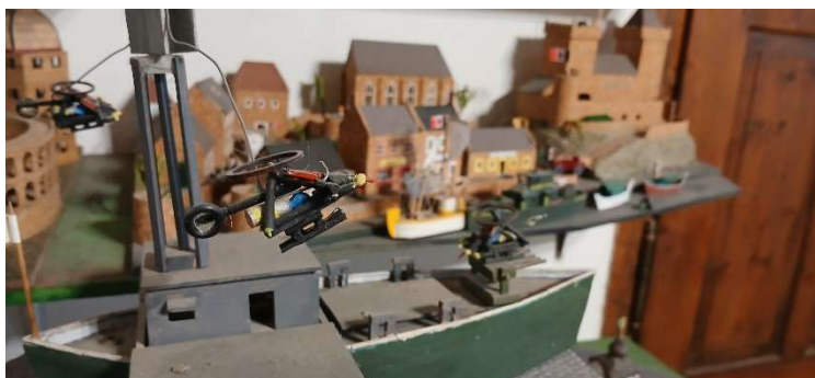
Letadlová loď Piraeus v blízkosti Kryspachu

Větrnická unie provedla minulý měsíc také orientační sčítání svého obyvatelstva + obyvatelstva celého iilandu (bez rošfórských vojáků na základně Katona). V současné době je v iilandu asi 14 000 lidí, z čehož je asi 13 000 bojeschopných.