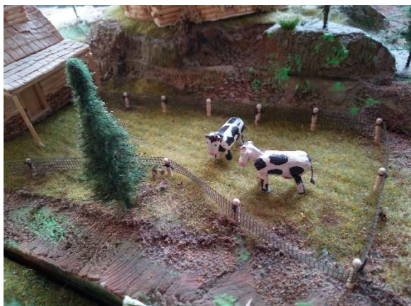
Krávy pod Zelenou horou