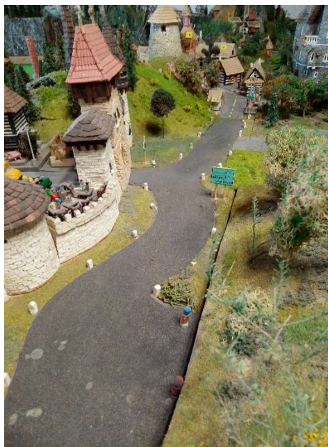
Středem této krajiny povede nová trať...

Kolem Szentlászlószékesegyházy povede železniční trať po havrányském území, železniční nádraží v Sharlandu bude ležet přímo na hranici. Jedna kolej bude pravděpodobně větrnická a druhá havrányská. Výstavba této nové trati bude velice rychlá, neboť terén není komplikovaný a až na malou zatáčku u Schad Bandau povede trať rovně. Cestující se budou moci kochat mimo jiné krákovskými hradbami a to i v noci, neboť celou trať budou osvětlovat nové žluté lampy. Větrnické státní dráhy (VÁV = Větrník Allami Vasútok) získali do svého portfolia i jeden nový vagón. Očekáváme, že se první cestující svezou novou tratí již na jaře.