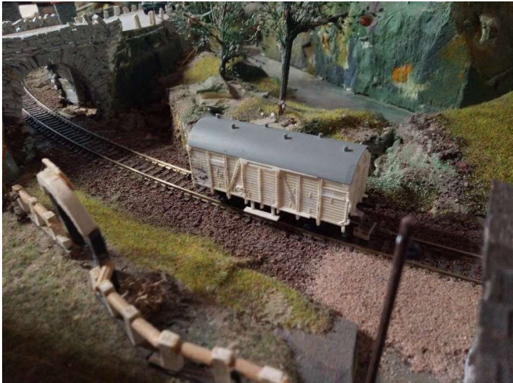
Nový vagón VÁV na nádraží v Kateřině

známá modlitební cesta a Větrný mlýn s Pavlovskou svatyní. Obě tyto hory již leží na území Větrnické unie. Na hoře Nuoli vede hranice mezi oběma státy.