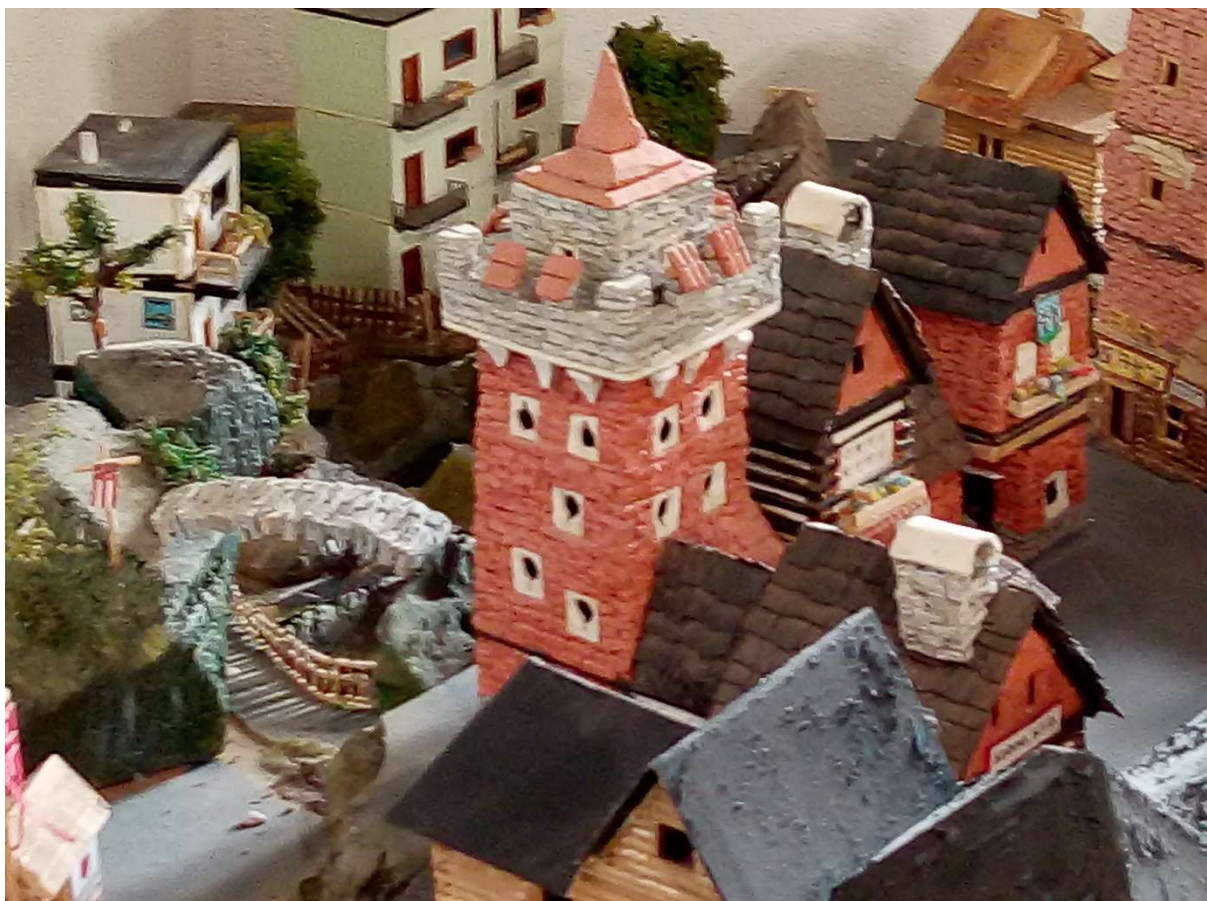
Idylický obrázek Gandoly, hlavního města VU a největšího města iilandu.

Demokracie by byla slabá, pokud by na totalitní tlak odpovídala demokratickým hlasováním. Pokud by v konfliktu na druhé straně stála demokratická země, tak by naše vláda hlasovala o své reakci. Za Langaru a Skogomadru nejednají panáčci, ale pouze bohové. Vždyť tam jsou u moci Retler a Gesler na věky věků. Nebo, přesněji řečeno – jejich bohové, kteří se neptají ani těchto dvou pánů na jejich názor. Tito bohové vlastně nepochopili princip života našeho světa. O všem rozhodují sami a ke svým občanům se chovají jako k mrtvolám.