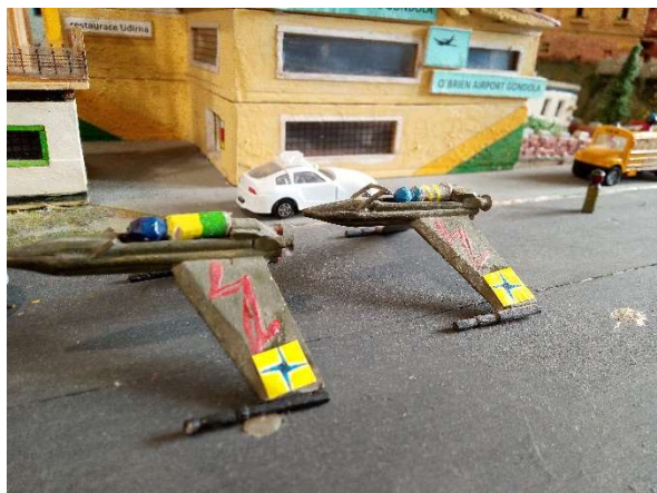
Letci jsou připraveni

Tyto aktivity měly ukonejšit obě agresivní země a měly za úkol je ujistit o tom, že nic nevíme. Opak byl pravdou. Již v letních měsících tohoto roku 2023 se začala VU intenzivně připravovat na obrannou válku. V současnosti je síla armády VU a iilandu taková, že by jakákoli agrese ze strany těchto zemí zcela jistě skončila jejich fiaskem. Naopak, pravděpodobně by celý konflikt skončil připojením těchto zemí k iilandu. Ale protože by asi některý z jižních bohů dostal infarkt, Větrnická unie toto obsazení neplánuje.