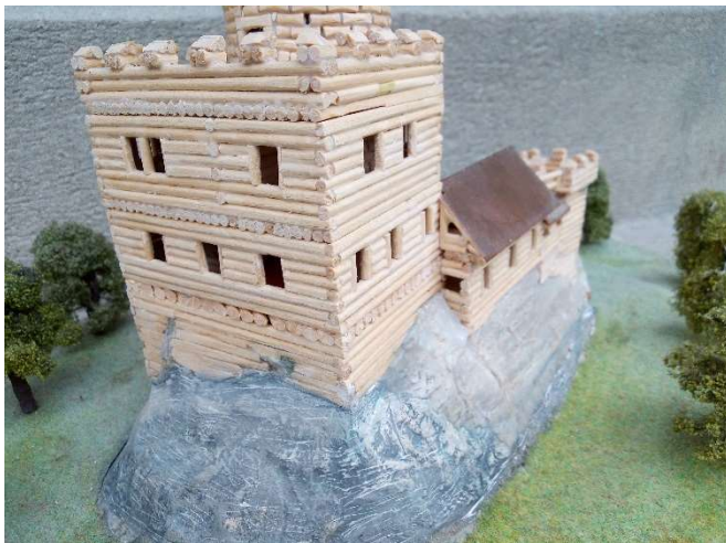
Hrady SFK vyrůstají na skalnatých ostrozích...