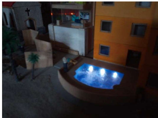
I v době krize se boháči koupají...- Mariana Beach (RŘ)