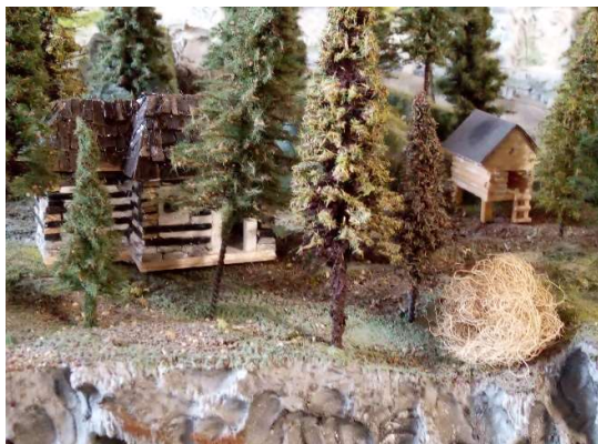
Jediný nový dům...a krmelec...