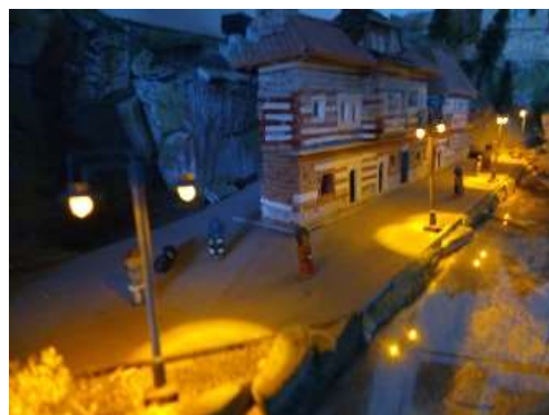
Nábřeží v Sharlroa s pouličním osvětlením...

V době od 20 prosince až do Nového roku 2024 bude v iiilandu ke spatření výstava betlémů. Někdo by mohl namítnout, že betlémy nepatří do idey iiilandu, ale při meditacích našich věštkyní vytanulo na mysl, že i náš Bůh Pavel má nad sebou snad nějakého dalšího boha a ten je zřejmě nějak spřízněn s tím malým Jezulátkem, které spočívá v oné slaměné kolíbe. Aby oslava tohoto Jezulátka získala potřebný šmrnc, bude ovšem nutné markantně zvýšit osvětlení celého iiilandu. Proto se tímto článkem obracíme na amazemské inženýry, kteří by měli do iiilandu přinést a zapojit dalších 16 pouličních světel. V přiloženém snímku nábřeží přístavního města Sharlroa je celkem spolehlivě vidět, jaká světla máme na mysli. Nemělo by to být železniční osvětlení, mělo by to být osvětlení pouliční.