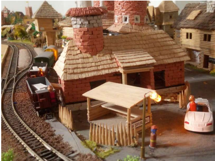
Prudké lampovné světlo ve Větrníkove

nebo sovoevském území a to na jedné z vytypovaných lokalit. Uvažuje se o prostoru pod hradem Newcastle, o části Gondoly Elizabeth a nebo o sovoevském území pod horou Soví věž. Havránci si myslí, že to není potřeba, protože ve Větrníkove jsou větrné mlýny na výrobu elektřiny. Větrnická vláda se však nyní opájí myšlenkou výstavby mohutné a ohyzdné atomové elektrárny, která by ze svých komínů vyvrhovala do ovzduší mohutný proud kouře.