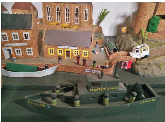
Papundekl nebo balsa?

Ve Větrnickém vojenském štábu proběhla v minulých dnech debata o tom, z čeho staví langarští inženýři a stavitelé svoji vojenskou techniku a zejména loďstvo. Lodě Langary, kotvící kolem Kryspachu, jsou samozřejmě nedotknutelné, byly však podrobeny pečlivému vizuálnímu zkoumání pomocí zaostřených hvězdářských dalekohledů z větrnických plavidel pohybujících se v mezinárodních vodách. Větrnický vojenský štáb také pečlivě vše fotograficky zdokumentoval. Větrníci odborníci se domnívají, že základním materiálem pro stavbu těchto bojových plavidel je balsa, kterou dokáží langarští stavitelé umně prohýbat. ,