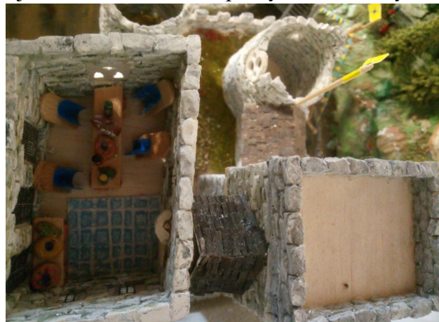
Nalevo nově zařízená místnost v Pembrokenshire