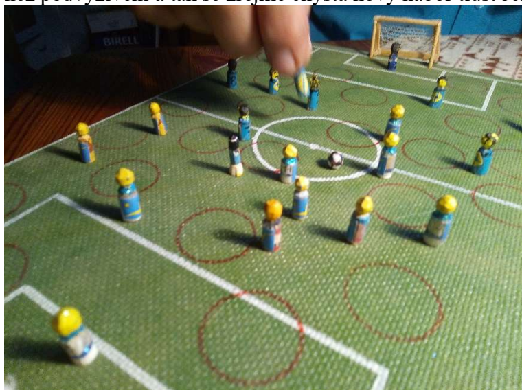
Utkání KK x HA

O víkendu 5. září se uskutečnil v Gondole malý fotbalový turnaj za účasti Kateřinského království, Havránye a Větrnické unie. Turnaj vyhrála podle očekávání Větrnická unie, která porazila v prvním utkání Kateřinské království 2:1 a ve druhém smetla Havrány 3:0. V boji o druhé místo vyhrála Havrány nad Kateřinským královstvím hubeným výsledkem 1:0. Pro všechny týmy byl turnaj velkou zkušeností. Bylo zjištěno, že tlustší fotbalisté jsou fakt asi lepší než podvyživení a tak se zřejmě chystá nový nábor tlust'ochů do všech týmů.