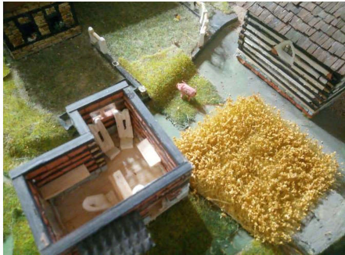
Tato hospoda bude sportovcům k dispozici...

Zajímavou změnou bude zřejmě sprint. Bude poněkud delší – poběží se celkem na 56 metrů. Naproti tomu – štafeta bude zase výrazně kratší než obvykle. Olympijský stadión se v současnosti v KK renovuje a opravuje. LOH 2020 se stanou zajímavou reminiscencí, neboť si budeme moci vzpomenout na první světové LOH v Gondole. Zahájení totiž bude na staříčkém, ale vylepšeném stadiónu prvního vítěze OH všech dob – Františka Neptuna z dávno zaniklého státu Spider City.