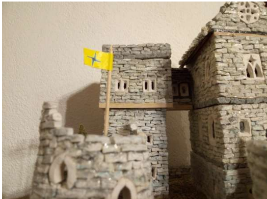
Pembrokeshire a jeho úžasný růst

Rychlost výstavby tohoto hradu je důkazem nynějšího ohromujícího stavitelského rozvoje Větrnické unie. Čtenáři si mohou porovnat snímky z minulého čísla Nuoli se současnou fotografií.