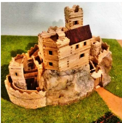
Želiv - SFK

Ministerstvo kultury se táže Rošfórské říše a Skogomadry, zdali jim může vytvořit na webových stránkách odkaz, který bude obsahovat fotky jejich hradů, které byly již využity při výrobě pexesa.