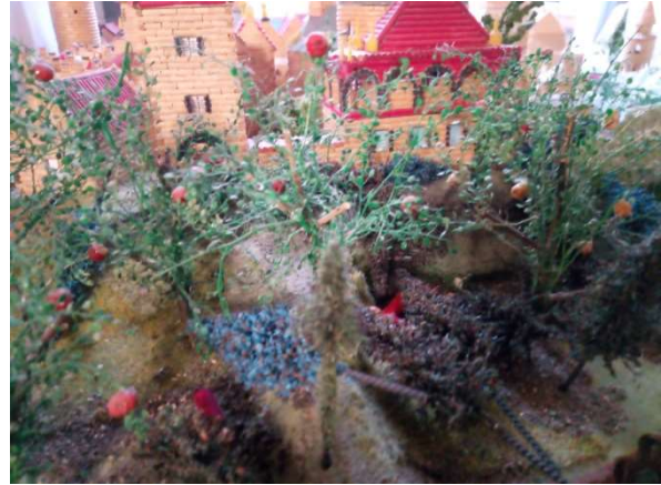
Odvoz a kácení stromů v Sovovu

"Jakpak by se asi líbilo Skogomadře, kdybychom dohlíželi třeba na neutralitu Langary?" otázal se sám sebe senátor a hrabě Samuel Ferguson.