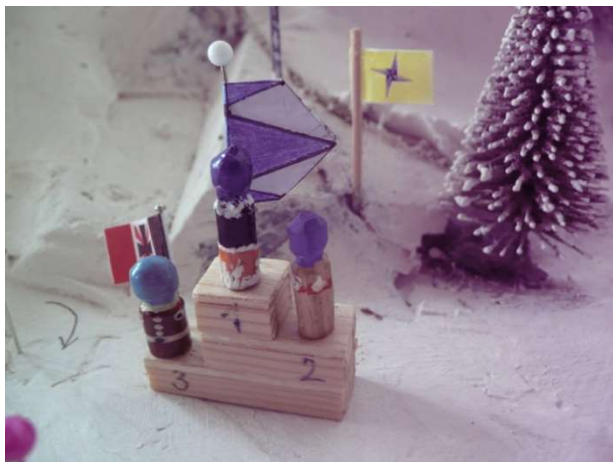
Připomínka ZOH v Elwingu