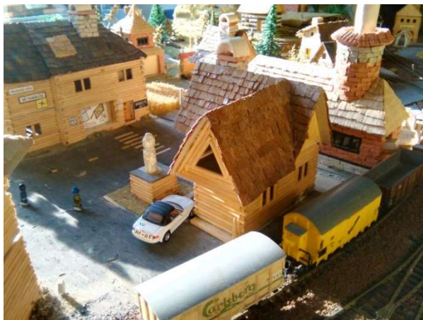
Staré nádraží Větrníkov je již minulostí