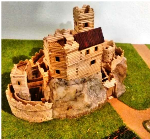
Skogomadrský Želiv s novou trávou

B) Pexeso iilandských hradů - 16 dvojsnímků hradů. Objeví se zde iilandské hrady, avšak také asi 6 hradů Skogomadry (pokud nemá SF nic proti tomu).