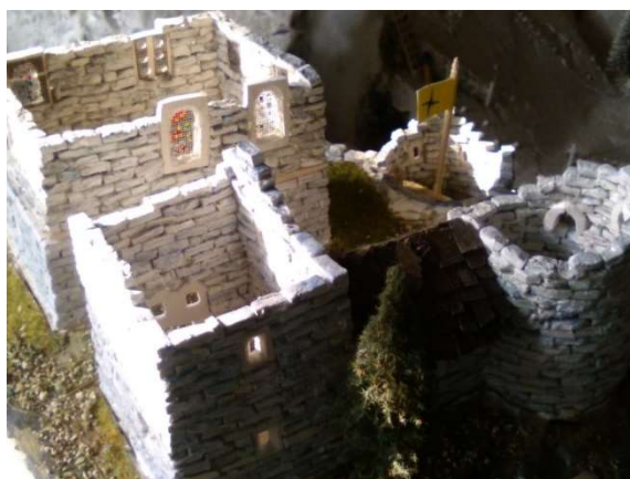
Pembrokenshire, vlevo i vpravo

Jeho Pembrokenshire se rozkládá na srmém skalním útesu v regionu Sharlroa. Má rozsáhlé podzemí a vstoupit se do něj dá pouze z mořské zátoky. Tam se příchozí dostanou pouze lodí, která zakotví u jeskynního portálu. Dále musí návštěvníci stoupat zvedající se skalní kavernou až do podzemních prostor hradu, kde po dalších dobrodružných peripetiích dosáhnou až vrcholu útesu s dosavadní "rozestavěnou" zříceninou samotného hradu.