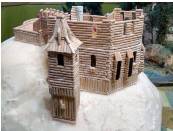
Severní část hradu Plumlov

Na oválném sopečném kuželi, v blízkosti sovoského Montesa, v podhůří Sovích hor, vyrůstá další architektonický dřevěný skvost. Hrad Plumlov.