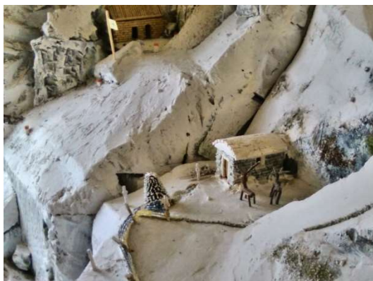
Tak zde by měla být lanovka

Projekt kovové lanovky, kterou měli vybudovat inženýři v Amezemu, byl zatím odložen k ledu a tak by mohli Sovováci pomoci. Jejich lanovka by však neměla elektrické ovládání a chyběly by rovněž mezisloupy.