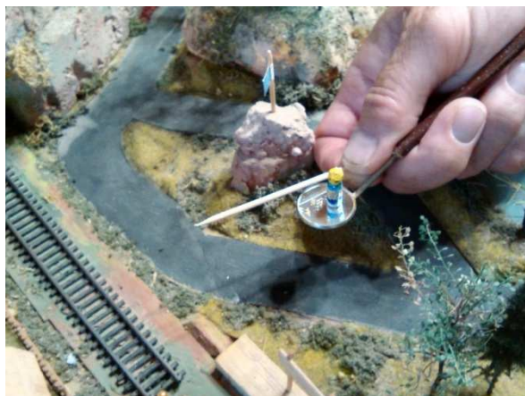
Havrányci už šerm trénují....