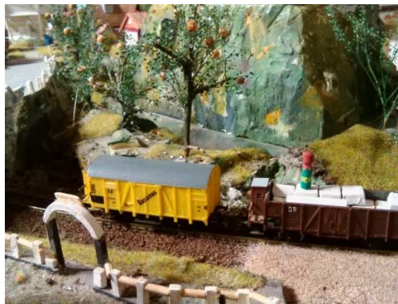
Černý mlýn - Sharlroa + bývalý vězeň na vagóně

Těšíme se také na přísun opravené techniky, která by měla dorazit na naše železnice ve stejných dnech. Celková délka tratí iilandu by měla dosáhnout 30 metrů. Nejvíce metrů má VU, na druhém místě je Království kateřínské. V celém iilandu je celkem 26 železničních stanic. Do tohoto počtu započítáváme i čtyři stanice gondolského metra.