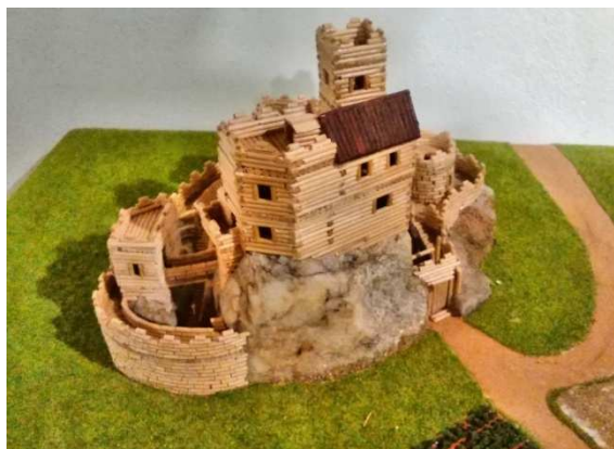
Želiv - je langarský nebo skogomadrský?

V iiilandu se na přechodnou dobu objevily skogomadrské hrady Templ, Canterville, Alkatraz, Jag a ještě další, které nelze jmenovitě identifikovat, neboť zde není žádný odborník, který by to dokázal. Ani pod střechami nejsou napsány žádné údaje, tak jak to avizoval bůh