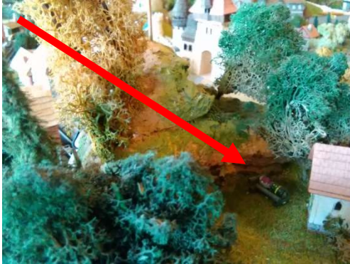
Individuum tak, jak jej vyfotila parta důchodců