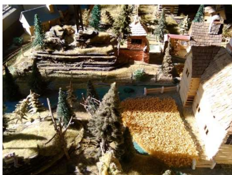
Nekonečné žitné enklávy Větrníkova

Po letech bezzemědělské půdy došlo v iilandu k zasévání obilí. Největší žitná pole se objevila za městem Větrníkova, v prostoru bažiny za obchodním střediskem. Další políčko vzniklo blízko přístavu Sharlroa a potom ještě několik v Království Kateřinském. Zde však zemědělci poněkud nedomysleli svůj ušlechtilý záměr. Jimi zaseté pole bude muset být vypleněno a na jeho místo bude položena kolej odbočky vedoucí od nádraží v Loch Mulardoch. A jak to vypadá s pěstováním květin? Některé nové sazenice vyrostly na hranicích sovovského Dynama a Větrníkova, chystá se také zúrodnění oken všech tří nádraží, která vyrostla v posledním půl roce pod