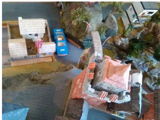
Auto A. Chřestýše vyfocené z dronu

Přítomnost Skogomadry na území iilandu by měla zaručit samostatnost států Juliánov a Adamov. Posádka by byla ve Větrníkově také v blízkosti hranic obou zemí.