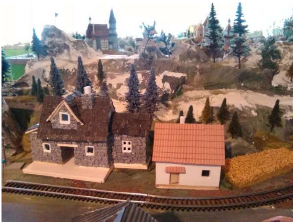
Nový stavební styl v Loch Mulardoch

Mariana Beach se konečně připojila ke kontinentální desce a dnes již sousedí s Královstvím Kateřinským! Větrníci stavitelé a tvůrci terénních úprav vyprofilovali ještě navazující skály a louky tak, aby zde nebyl příliš zřetelný žádný předěl. V současnosti dostavují nádraží a navážejí