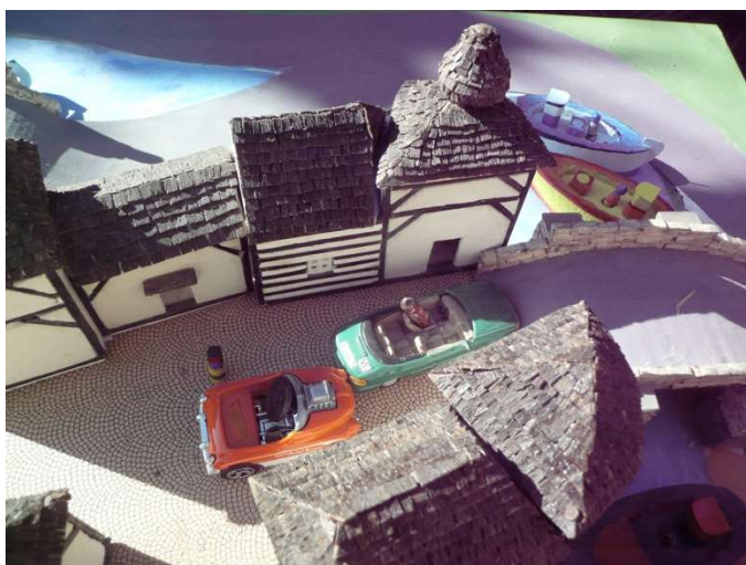
Olympijský Pupíkov dokončil pokrytí střech

Prosíme státy jako je Mon-Ferero, Skogomadru a Království Kateřinské, aby pořadatelům LOH v Pupíkově zaslaly elektronicky své vlajky. Hry si zaslouží být ozdobeny a státní vlajky jsou největšími symboly.