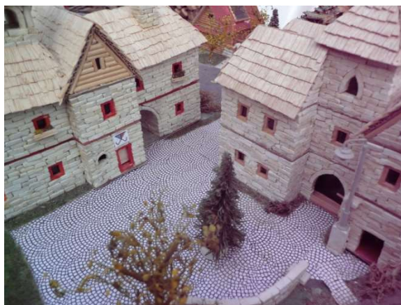
Náměstí Magdaleny Koňské - Juliánov