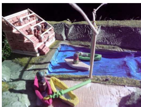
Trénink na kanále

Organizátoři již nejsou závislí na vodním langarském kanálu. Nový kanál vybuodovala firma Kebne spolu s havrányškými staviteli a tato stavba je opravdu skvostná. Větrníčtí sportovci na něm již tvrdě a pravidelně trénují a snaží se vychytat všechny figle tak, aby jižní státy neměly tentokrát šanci. Tím jim chceme vrátit naši porážku z poslední letní olympiády.