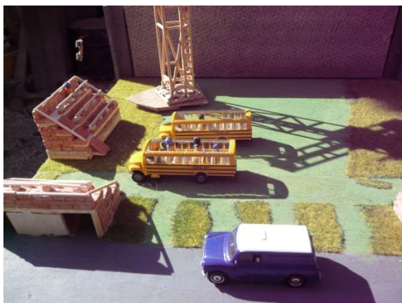
Střelecký areál Pupíkov

Na letošních LOH připravili pořadatelé také sportovní areál pro střelce. Tento areál má multifunkční význam. Havránci přišli na to, že po skončení her jej lze využít jako letní kino. Je to perfektní nápad, protože celá přestavba bude v podstatě velice jednoduchá. Místo terčů se o zeď opře prostě tablet. Už se těšíme na první záznamy z LOH.