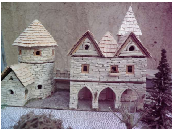
Artisanská radnice - Adamov