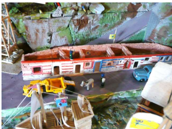
Přístav v Sharlroa

představitele kvůli tomu, že ztratili jejich dar. Tato strana věnovala na zkrášlení olympijského Pupíkova osm stromů a nádhernou sadu květin. No a Havránci vše ztratili. Král Maro Trebo sice tvrdí, že se všechno najde, ale VU je touto nepořádností hodně omezována.