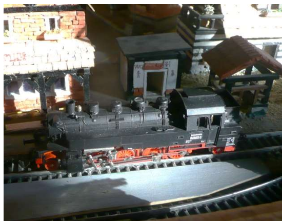
Nová větrnická mašina

Větrníčtí zemědělci by totiž rádi vyměnili pár květin za zelené polní trsy nezralé řepky olejky. Chtěli by trošku více zkrášlit pole, která se nyní vysazují v katastru obce Newcastle. Zde nyní probíhá, vedle Sharlroa, největší rozvoj. Byla zde postavena první moderní autobusová zastávka. V Amezemu byly při poslední návštěvě iiland'áků z galaxie STB upraveny dva autobusy, kterým byla uříznuta střecha. První pravidelná autobusová linka spojí Sharlroa se Szentlászlószékese gyház, což je přibližně vzdálenost 55 dm.