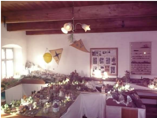
SG iilandu - největší kompaktní osídlení Vesmíru