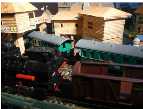
Větrníkovo je nejzaprášenější město v iilandu