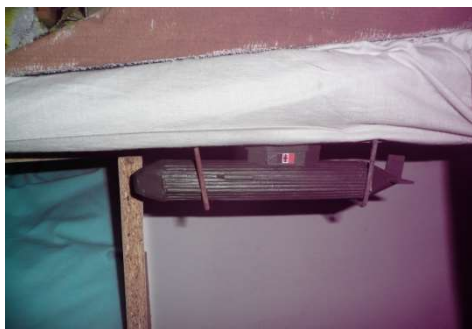
Langarská ponorka střední velikosti v moři pod iilandem

Lze to samozřejmě hodnotit jako celkem povedený husarský kousek langarské generality a jako políček do tváře našeho nynějšího ministra obrany Pepy Vytahovače. Demi Marten zvažuje jeho odvolání a nahrazení někým jiným.