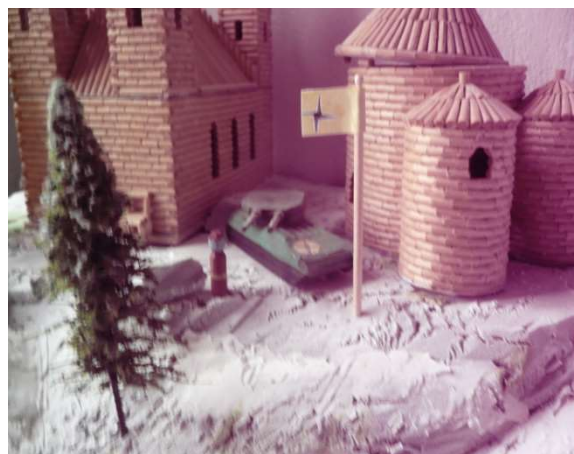
1Větrnická vojska v Montesu a Dynamu

název tohoto státu, atd. Gubernérem této větrnické nové provincie se stal Broki Embro. Jeho první prohlášení obsahovalo sdělení, že iilandský Sovov neuznává Langaru a Skogomadru jako svébytné země, neboť i ony chovají nepřátelství k Brokimu Embrovi.