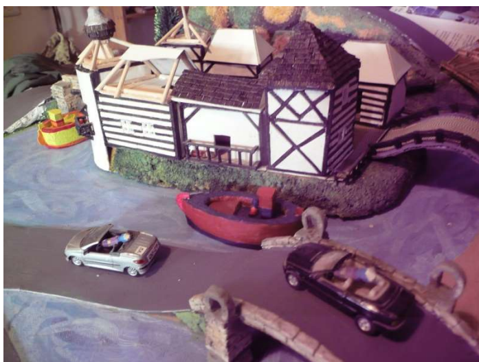
Lepení šindelů v Pupíkově