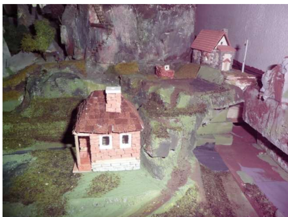
Nový dům v Newcastlu a zatím holopoušť kolem

VU rozšířila své území o 8 dm 2 . Jedná se o území, na kterém vzniká vesnice Newcastle. Na nové ploše, která se vynořila z mořské vody, probíhá nyní odsolování. Brzy se započne se zalesňováním. Je potěšitelné, že na malém pahorku zaseli zemědělci také obilí. Ve večerních hodinách dnešního dne se mají v kraji objevit zalesňovači. Takže – zase kousek hezké krajiny, kam budou moci zajíždět mladí se svými velocipedy a maminky se svými kočárky.