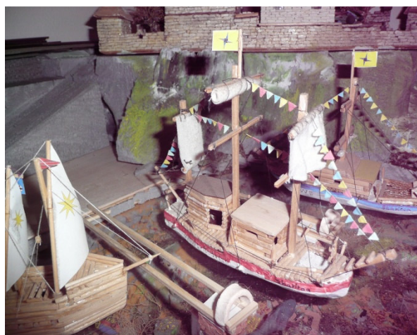
Přístav v Sharlroa zabydlily lodě

Sharlroa zažilo na začátku měsíce února roku 2016 velké zemětřesení. Nejhuře dopadl Moulin Rouge. Celý tento objekt se zřítil ze skály a pod jeho troskami sténali čtyři sharlroišští občané. Po abnormálně vysilující záchranné akci byli všichni tři vyhrabáni z trosk a vrtulníky převezeni do gondolské nemocnice. Dnes jsou již všichni tito bývalí pacienti zdraví, ale i dnes mají psychické problémy středně těžkého rázu a vždycky, když se něco pohne, tak jim je špatně. Při tomto zemětřesení zalila následná tsunami sharlroiskou kotlinu a moře dosáhlo až ke městským skalám. Větrníčtí stavbaři počkali, až se mořská hladina uklidní a během tří týdnů usilovné práce vytvořili hrubou stavbu přístavu. Sharlroa se tak stal po Patricii prvním přístavem s mořskou vodou. Známým přístavem je rovněž langarský Langsterdam, v tamějším přístavu je však voda zakalená a neprůhledná. Přístavní vody Sharlroa jsou zatím poměrně čisté. V hloubce u dvou pilotů se prohání barevné rybky a blízko nich se dokonce zabydlil žralok.