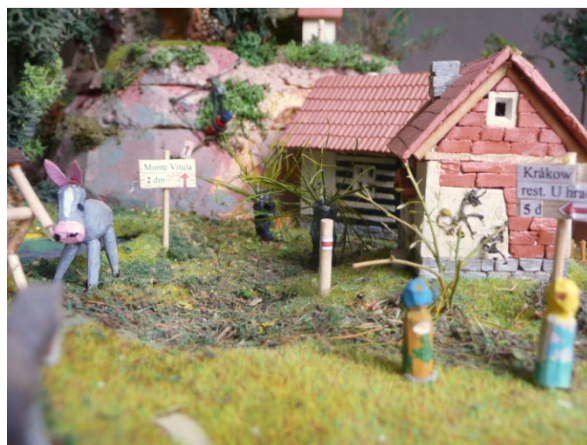
Občané iilandu nad septikem