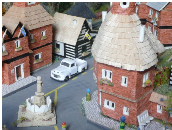
Bílé auto na náměstí Madony - Avandiv VU