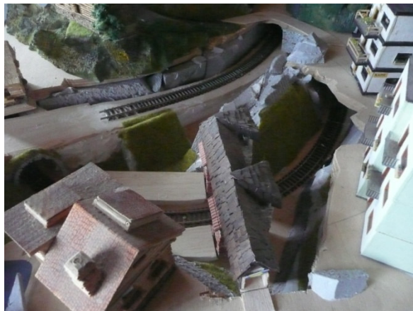
Rozestěvena stanice metra Elizabeth

Dnes se na území Kateřinského království dodělává silnice E 5,5; která se stala největší silniční magistrálou světa. Ještě chybí patníky, čáry a zbývá srovnat několik nerovností.