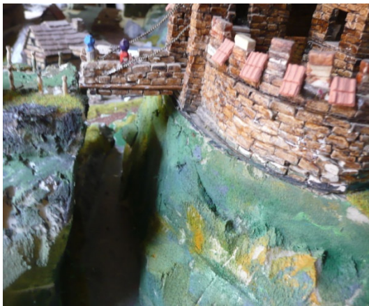
Turisté z VU na Kateřině

K určité chybě došlo však při pokládání zeminy jako podkladu pod koleje. Inženýři zde zkoušeli nové technologie pokládání vrchní zeminy a krajinu docela zašpinili a zdevastovali. No, snad to po sobě uklidí. Někteří občané VU již na tento neutěšený stav poukázali a tak snad bude zjednána náprava. Někdo by za to však měl být zodpovědný. Policie VU nyní pátrá po skupině stavitelů, kteří asi před čtvrt rokem navštívili Amezen, kde měli dávat při instruktáži pokládání zeminy větší pozor.