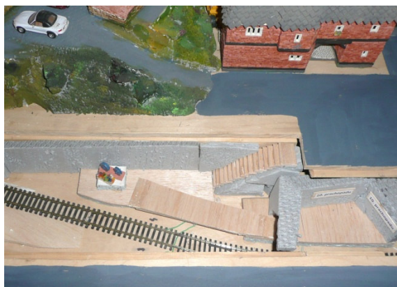
Gondola-centrum a Metro - 10. prachopadu

Ve stanici Gondola-centrum vznikl i malý památník na otevření této podzemní stanice. Na podstavci jsou zde umístěna dvě železniční kola.