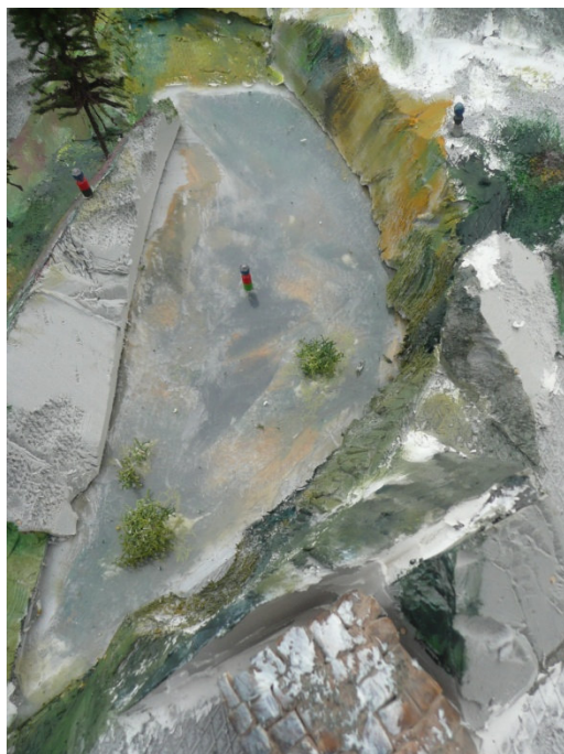
Zatím bezejmenné zamrzlé jezero - KK

V příloze posíláme přihlášky na II. ZOH Hollószikla. Bylo by dobré poslat tyto vyplněné přihlášky zpět do Gondoly do 20. srpna 2015. Organizačnímu výboru ZOH se tím ulehčí značně práce. Děkujeme.