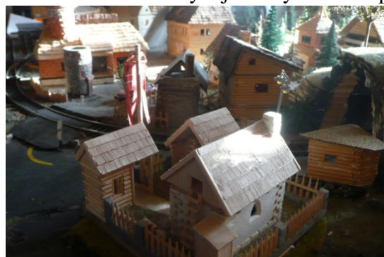
Budova velvyslanectví RŘ na novém místě

Vyslanectví Rošfórské říše bylo přestěhováno z centra města Větrníkov k tunelu vedoucímu pod hřeben hory Kebnekajse. Tento posun byl realizován pomocí kulatých kmenů klád (špejlí) a celá budova byla posunována opatrně asi o 30 cm. Vše se naštěstí podařilo bez úhony na zdraví a na stavbě. Nyní je velvyslanectví přímo u železniční zastávky a celková koncepce takto