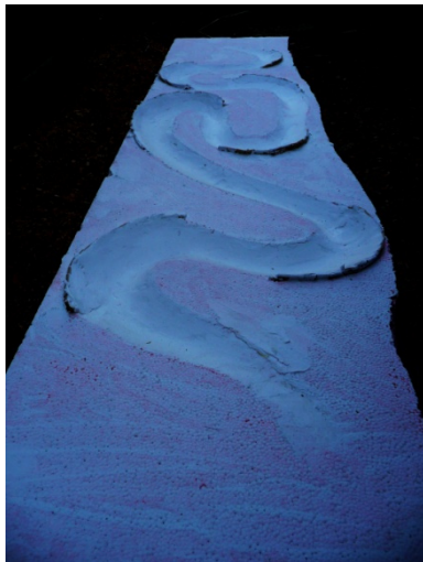
Bobová olympijská dráha

Přípravy na ZOH probíhají ve stejném spěchu jako stavba metra. Větrníčtí sportovci již začali trénovat na nové bobové dráze, která bude dějištěm napínavých soubojů ZOH 2015. Zároveň byl stanoven i termín ZOH. ZOH se budou konat v prvním zářijovém víkendu 4.- 6. září 2015.