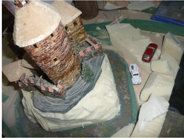
Stavba vodního příkopu - Kateřinský hrad

Větrníkov a Havrány navštívila v nedávných dnech delegace z Kateřinského království. Odborníci obou zemí vytyčili územní plán a zabývali se úpravami terénu – podkládání železničních násypů pro vláčky kategorie TT.