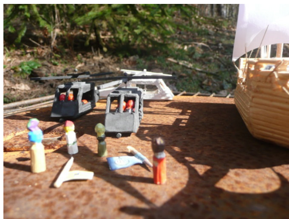
Jednání o referendu mezi VU a RŘ dne 7.3.2014