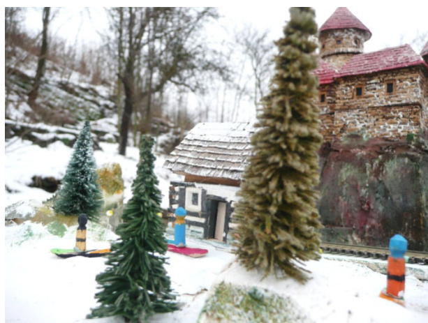
Trénink snowboardistů pod Newcastlem

Na začátku března navštívila větrnická delegace Rošfóorskou říši a krátce se setkala i s langarskými občany. Jednalo se o neformální návštěvu, která měla za cíl v první řadě odvelet letadlovou loď Karel ze Skal, dále pak prohlídku nových hokejových hřišť, seznámení se s pravidly této hry v pojetí států Jižní galaxie a v neposlední řadě zjištění situace, která by umožnila přesun kontinentální desky s městem Větrníkov do Galaxie HB. Do langarského Langsterdamu také dorazila Selma Lagerlöfová, která by měla na zdejší univerzitě učit. Dalším cílem návštěvy bylo dopravení obchodního domu, který by se v tomto přístavu měl stát výkladní skříní větrnického zboží. Nabízený "tovar" však zatím nesplňuje kritéria, které by si naši lidé představovali. Nicméně – v podkroví nabízí firma Kajse některé zimní doplňky, které budou rozhodně potřebovat sportovci na ZOH. Např. snowboardy a boby. Jeden z bobů je však již zamluven a patří knížeti Havranovi z Rošfóorské říše. Má právo si vybrat. Druhý bob je k prodeji za 8 gam.