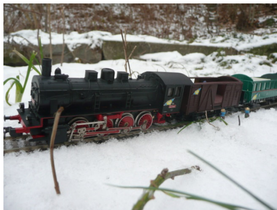
Vlak H0 s výsostnými znaky VÁV

Brzy se ovšem tratě TT v iilandu značně rozšíří – v první etapě především o gondolské metro – asi 25 dm tratě a později i o spojnicí (nejdelší most na světě), která povede mezi přístavem Sharlroa a Newcastlem (kolem 12 dm).