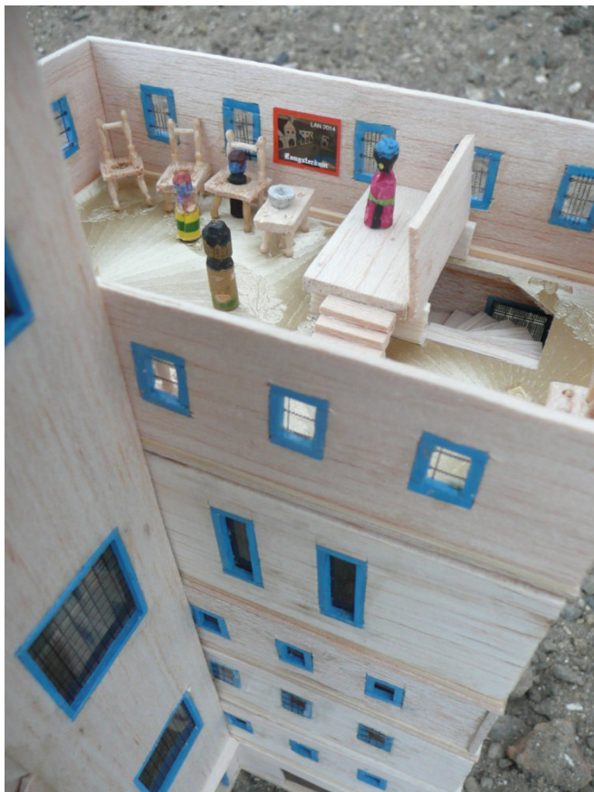
Stěny mrakodrapu Větrný dům zdobí langarské obrazy

starosta Gondoly a ředitel stavební firmy Kebne