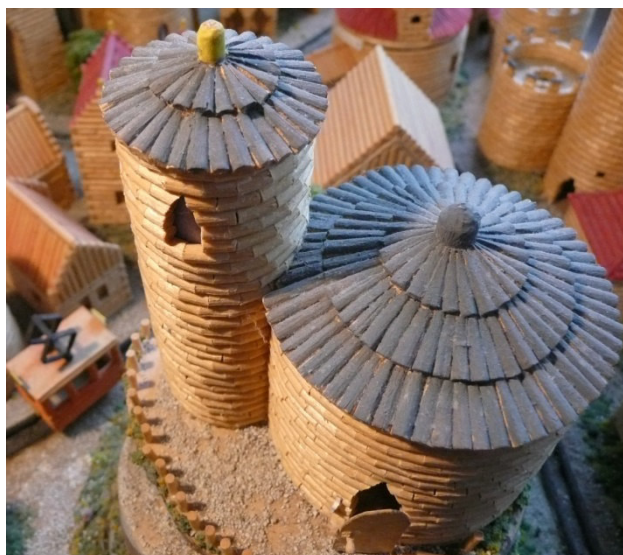
Rotunda v hlavní městě Sovova - Montesu